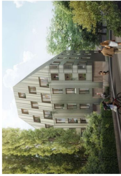
Schaubild Korosistrasse | Rottalgrasse