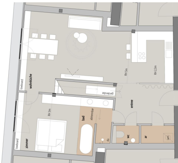
TOP5+6 DG 1:100