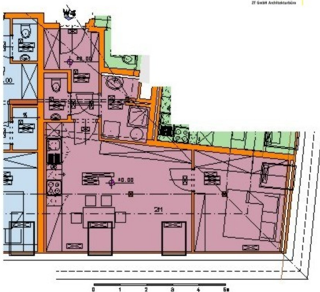
Dachgeschoss W4 Nutzfläche gesamt 46.33 m 2