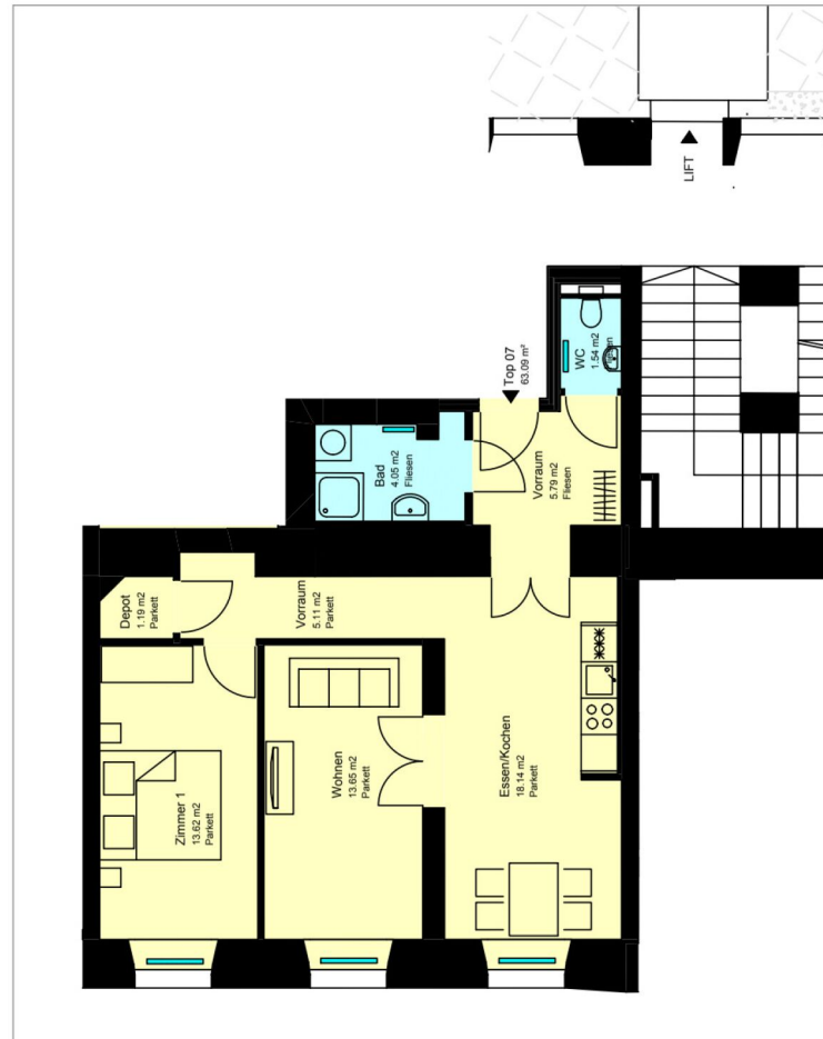
Top 07 - 1:100